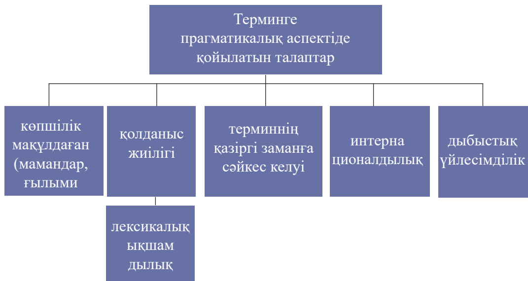
3-сурет – Терминге прагматикалық аспектіде қойылатын талаптар