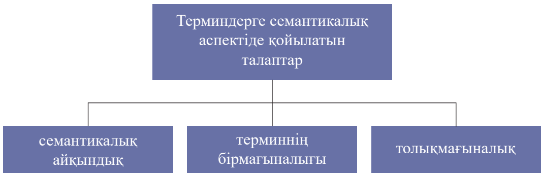
1-сурет – Терминге қойылатын талаптар

Терминдер үнемі өздеріне қойылған талаптарға сай келе бермейді, себебі көптеген терминдер көпмағыналылық қасиетіне ие болып, ұғымдарға сәйкес келмеуімен бірге синонимдер қатарын да толықтырып жатады.